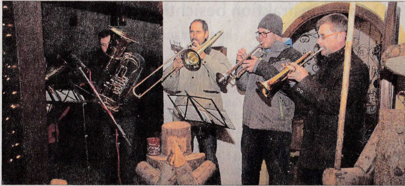
Die Stadtkapelle spielte weihnachtliche Weisen.