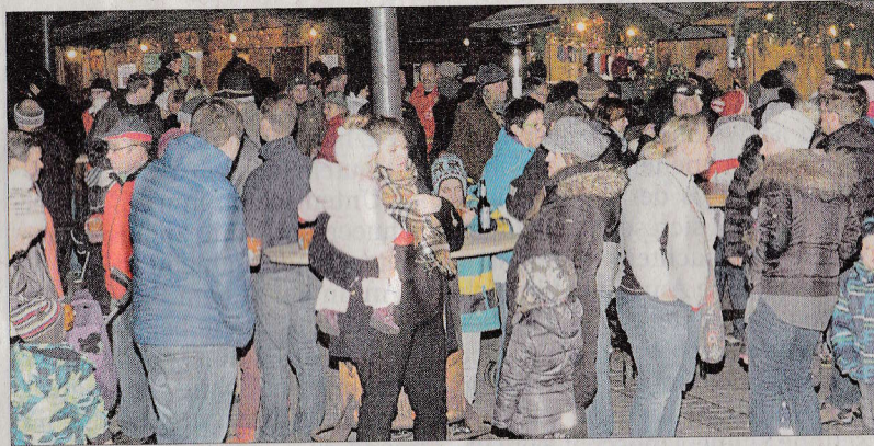
Dicht gedrängt standen die zahlreichen Besucher am Freitagabend.