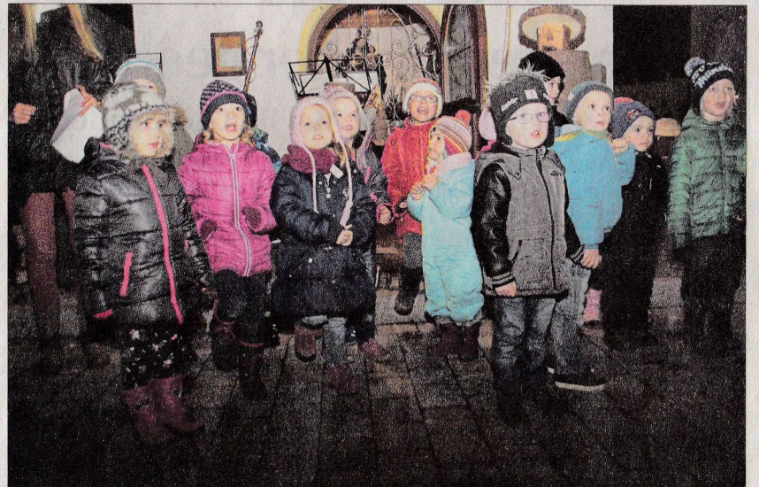
Die Kleinen des Kindergartens Sonnen-Blume erfreuten mit Liedern.